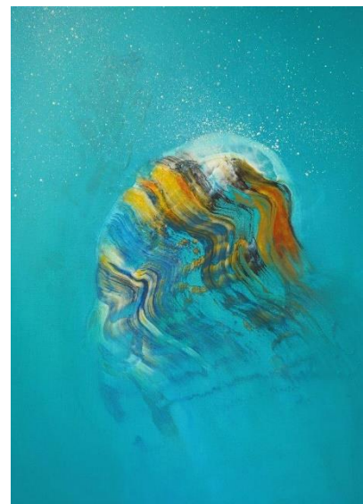
Hinrich JW Schüler: Farbraum und Tiefe - „Aquasphere“ (2022)