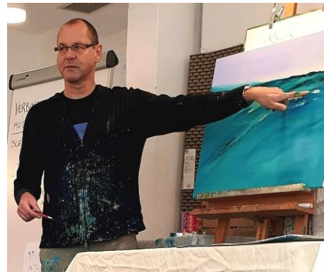
Analyse und Korrektur der Teilnehmerwerke