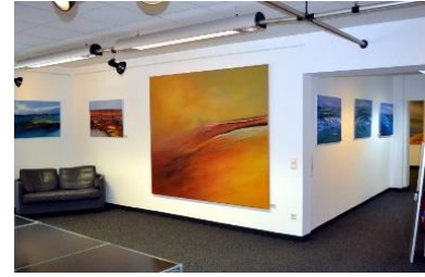
Mein Atelier in der Villa Wandershof, Düsseldorf-Grafenberg